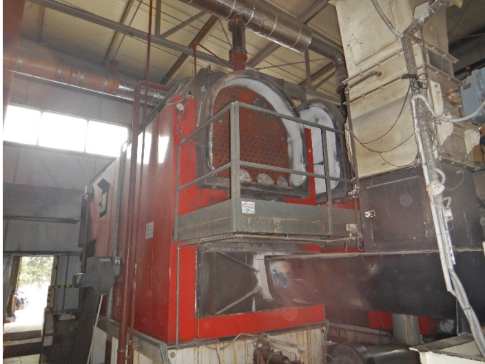
Fot. 1 Widok kotła do modernizacji